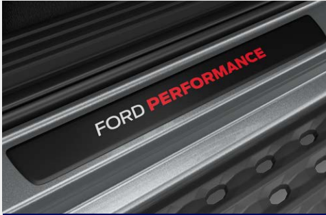
Ốp bậc cửa