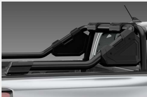
Thanh thể thao Falcon - Hammer