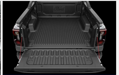
Lót thùng có logo Ford