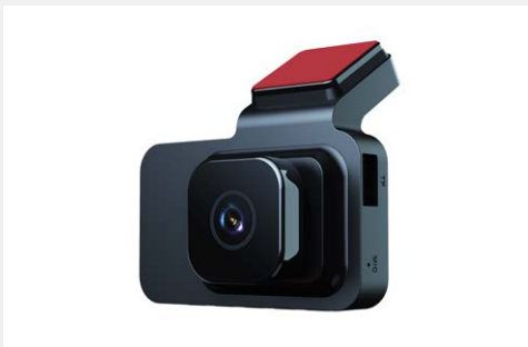
Cam hành trình - Mozhu S3 Cam trước