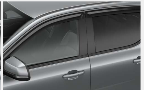
Vè che mưa - 1 set 4 chiếc