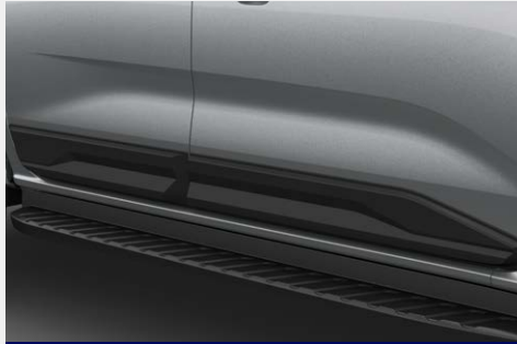
Ốp cánh cửa