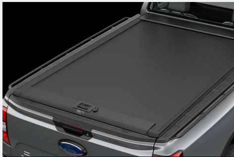
Nắp thùng cuộn điện