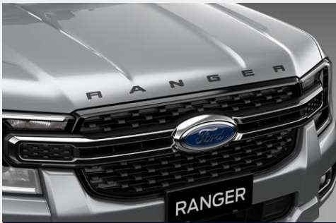
Chữ Ranger trên mui xe