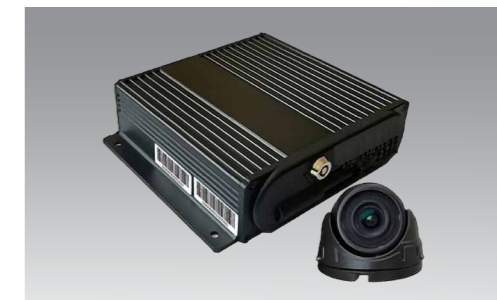
Camera + Thiết bị định vị