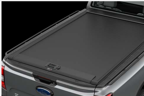
Nắp thùng cuộn điện