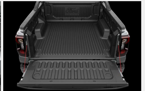
Lót thùng có logo Ford