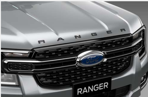
Chữ Ranger trên mui xe