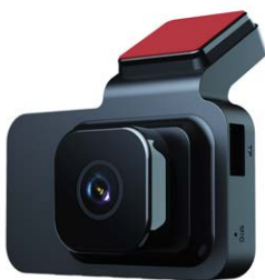
Cam hành trình - Mozhu S3 Cam trước